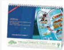
"da tavolo triangolare"