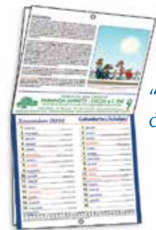
"compatto da parete"

DEPLIANT OFFERTA ALLEGATO A QUESTA RIVISTA