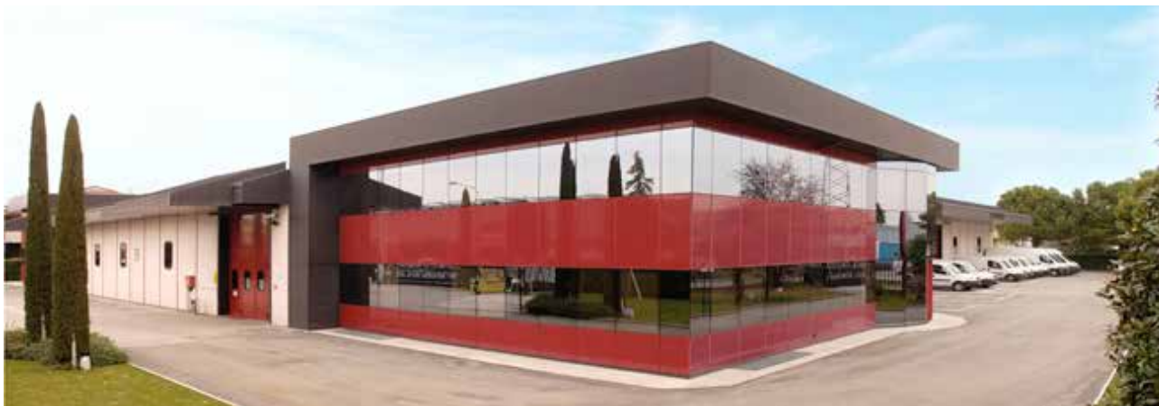
La sede di Maxima S.p.A. a Bussolengo, VR