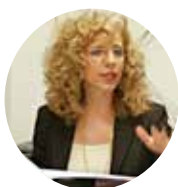
di LORETTA SIGNORETTO DIVISIONE SCIENTIFICA PHYTO GARDA

Tra i rimedi naturali più utili appare innovativo, anche se il suo uso è tradizionale, il muco o bava di lumaca, reale alleato contro la tosse in tutte le sue manifestazioni.