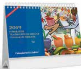
Calendario da tavolo

Info e novità su www.calendariodellasalute.it