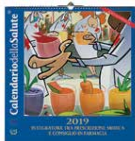
Calendario compatto da parete