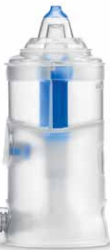
Rhino Clear ®

Rhino Clear è un accessorio compatibile con tutta la gamma di aerosol Flaem.