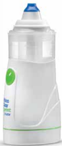
Rhino Clear ® Sprint

Rhino Clear è un accessorio compatibile con tutta la gamma di aerosol Flaem.