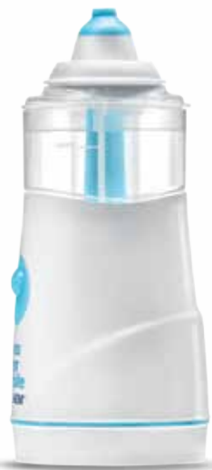
Rhino Clear ® Mobile

Rhino Clear Sprint è una doccia nasale portatile alimentata con batterie AA.